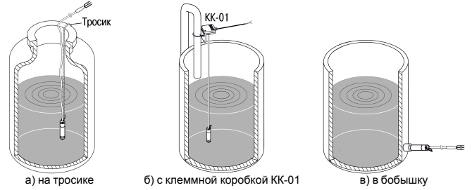
Рисунок 2 – Примеры монтажа на объекте

Для более удобного монтажа преобразователя рекомендуется использовать клеммную коробку КК-01 производства фирмы OWEN. Клеммная коробка позволяет зафиксировать преобразователь на вертикальной плоскости или вертикальной трубе, а также выполнить стыковку сигнального кабеля с капилляром преобразователя с обычным сигнальным кабелем внешних устройств. Клеммная коробка КК-01 доступна по отдельному заказу.